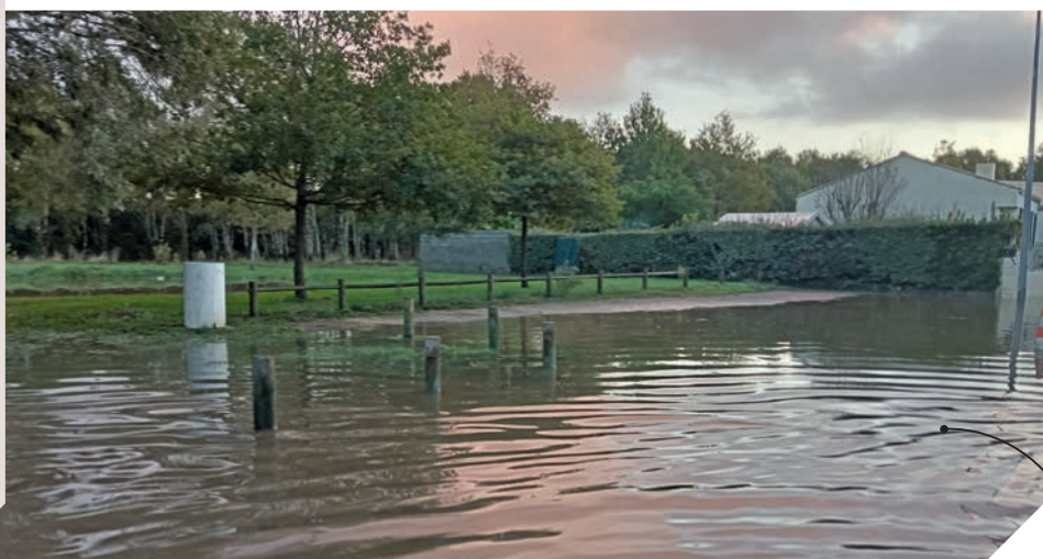
Le secteur de la Juisière après le passage de la tempête Kirk.

Lors des événements pluvieux du 9 octobre dernier, deux zones ont été particulièrement impactées par les inondations : le centre commercial du Môle, à cause d'une mise en charge des réseaux eaux pluviales et eaux usées, et La Juisière, plus précisément le square Jean-Cocteau. Dans ce secteur, la digue existante a été renforcée et le pompage a été activé dès 15h. La situation était stabilisée mais à 19h30, un nouvel orage a réactivé le phénomène. Le débit du ruisseau de Pont-Habert a freiné l'écoulement de celui de la Poctière, ce qui a provoqué une mise en charge des réseaux et un débordement de la digue malgré la mise en place de sacs de sable supplémentaires. Dix-sept habitations ont été exposées.