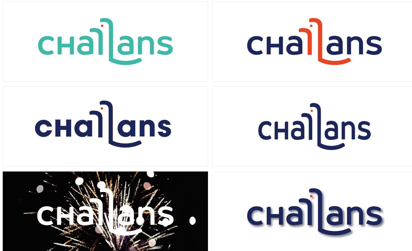
— Exemples d'applications interdites

IL EST IMPÉRATIF DE RESPECTER LES RÈGLES D'APPLICATION DU LOGOTYPE.